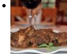
Rabo de toro con setas [1]

En esta ocasión os presentamos un plato tradicional, elaborado con los mejores ingredientes y que no dejará indiferente a nadie.