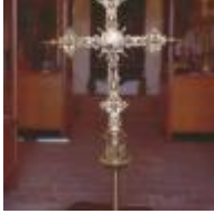
Gemeinde museum S. Juan Bautista [8]