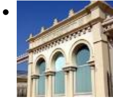
Fischbörse Lonja Del Pescado [4]

Das Gebäude besteht aus einem Längsschiff mit Querelemente. Nach Übergang in städtischen Besitz wurde es saniert und wird seitdem als Ausstellungsraum genutzt