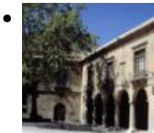
Archäologisches Museum Camil Visedo [10]