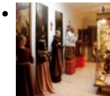
Pfarrkirche-Museum Sankt Mauro Und Sankt Francisco [12]

Das Museum befindet sich neben der Kirche und bewahrt eine Sammlung über religiöse Kunst, unter der einige Malereien, Figuren, Gegenstände und Verzierungen hervorzuheben sind.