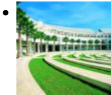
Museum Der Universität Alicante [5]