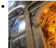
Museum El Patriarca [5]