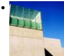
Museum Der Aufklärung Und Moderne (Muvim) [9]