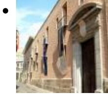
Museum Des 19. Jahrhunderts [4]

Dieser Kulturraum befindet sich im ehemaligen Kloster Convento del Carmen. Derzeit können Wanderausstellungen besucht werden.