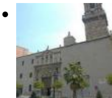
Kloster Santo Domingo [10]