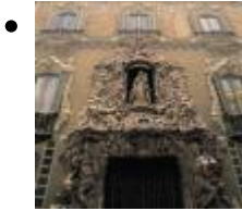
Nationales Museum Für Keramik Und Prunkhafte Kunst González Martí [8]