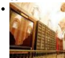
Historisches Museum [12]