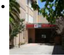
Ausstellungsgalerie der Fachhochule von Cheramik [11]

Hier kann man alle möglichen Kunstwerke sehen, aber hauptsächlich die aus Cheramik.