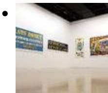
Ausstellungsgalerie Keramiker Gimeno [14]

Die Galerie befindet sich innerhalb des Hauses der Kultur und bewahrt mehrere Kunstwerke.