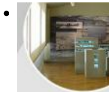
Museo de Oropesa del Mar [1]

Es handelt sich um einen panoramischen Besuch mit der besten Technologie durch die verschiedenen historischen Epochen des Dorfes und seine natürliche Umgebung.