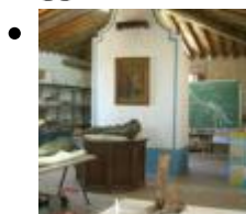
Klassenzimmer Der Paläontologischen Wiederbeschaffung [3]