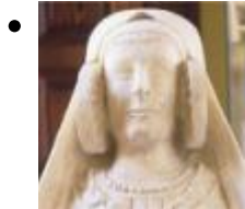
Archeologisches-, Völkerkunde- und Paläolithisches Museum [1]