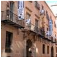
Kunstmuseum Gravina (Mubag) [12]