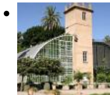
Botanischer Garten [3]