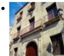
MUSEUM FÜR ZEITGENÖSSISCHE KUNST [15]