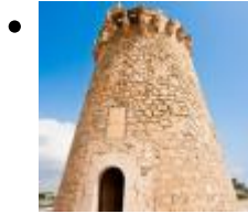
Museum turm von Marenyet [4]

Dieser Wachturm bewahrt Beispiele der Lebensart der früheren Soldaten.