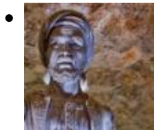
Höhle-Museum Von Dragut [6]

Die Piraten des Mittelmeers aus dem 16.Jh, ihre Angriffe- und Verteidigungsmethoden, sind der Mittelpunkt dieses Museums.