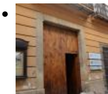
Völkerkundemuseum Von Denia [11]