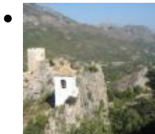
Museum Haus Orduña [14]