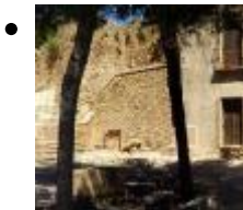
Archeologisches Museum Von Dénia [9]