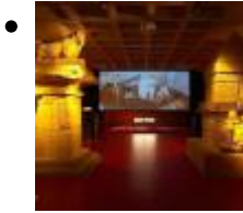
(MAHE) Museum Für Archäologie und Geschichte von Elche [7]