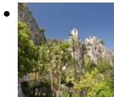
Völkerkundemuseum. Typisches Haus Aus Dem 18.Jh [3]