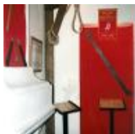
Historisch-Mittelalterliches Museum [6]

Hier werden verschiedene Folter- und Hinrichtungsmethoden aus dem Mittelalter gezeigt.