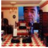
Museum Von Antonio Marco. Krippemuseum [4]