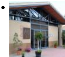
Zentrum für Traditionelle Kultur Pusol [9]