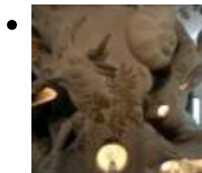
Museum Mikroriese [1]