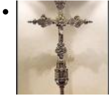
Pfarrliches museum [14]