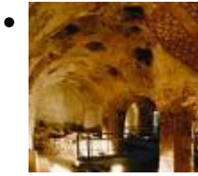
Arabische Bäder [4]