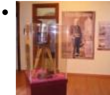
Museum-Haus Ingeniero Mira [10]