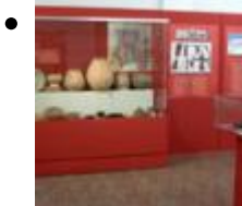
Städtisches Museum [6]