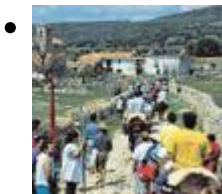
Von Culla nach Benicarló [6]