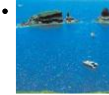
Von Peñíscola nach Castellón de la Plana [4]