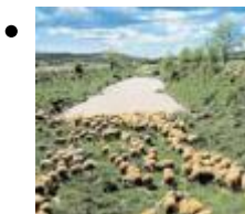
Von Barracas nach Sagunto [8]