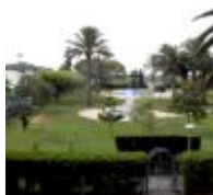
Devesa Gardens [2]