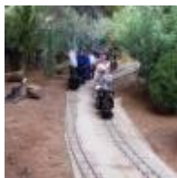
Centro Ferroviario Vaporista [1]