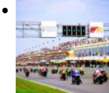
Die Rennstrecke des Landes Valencia Ricardo Tormo [3]