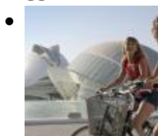
Ciutat de les Arts i les Ciències [2]