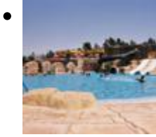
Segóbriga Park [9]