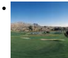
Alenda Golf [1]

Das iste in Golfplatz, das man in zwei verschiedenen Weise nehmen kann. Die 9 ersten Löcher sind ganz lustig und einfach, mit breiten Spielbahne und von lokaler, dichter Vegetation begrenzt.