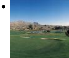
Alenda Golf [1]

Das ist ein Golfplatz, den man auf zwei verschiedene Weisen nehmen kann. Die ersten Löcher sind ganz lustig und einfach, mit breiten Spielbahnen und von lokaler, dichter Vegetation begrenzt.