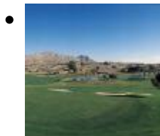
Alenda Golf [1]

Das iste in Golfplatz, das man in zwei verschiedenen Weise nehmen kann. Die 9 ersten Löcher sind ganz lustig und einfach, mit breiten Spielbahne und von lokaler, dichter Vegetation begrenzt.