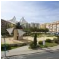
Plaza del Molino [6]