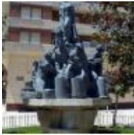
Plaza dels Geladors [8]