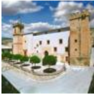
Plaza del Carmen [4]