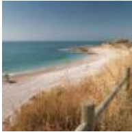
Cala Puntal [13]