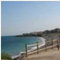
Cala Salines [14]

Diese kleine Bucht aus Kies hat in der absoluten Sauberkeit ihres Wassers eine ihrer Haupteigenschaften und ist ein idealer Ort für Unterwassersportaktivitäten. Die Landstraße, an der sich eine Busha...