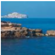
Calas de la Costa Sur [15]

Die Liebhaber der unberührten Küste werden südlich von Peñíscola einige kleine Buchten aus Stein und Kies mit sehr sauberem Wasser und großartigen Meeresgründen für den Tauchsport und d...