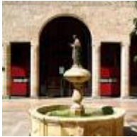
Ehemaliger Kornspeicher Almudín [7]