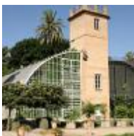
Botanischer Garten [9]