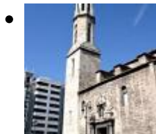
Pfarrkirche Santa Catalina Und San Agustín [1]