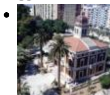
Kleiner Palast und Parkanlage Jardines de Ayora [3]