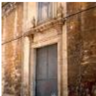
Pfarrkirche Santísimo Cristo Del Salvador [8]