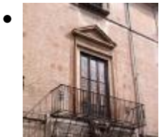
Palast Der Catalá De Valeriola [11]

Die Hauptfassade im klassizistischen Stil zeichnet sich durch die Eisenbalkone aus. Der Innenhof hat einen viereckigen Grundriss und über dem Gebäudeinneren erhebt sich ein Gewölbe.