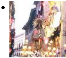
Feierlichkeiten Zu Ehren Der Mare De Déu Dels Desemparats [8]