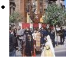
Feierlichkeiten Zu Ehren Von San Vicente Ferrer [7]