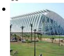
Museu de les Ciències Príncep Felipe [3]