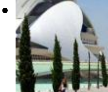
Palau de Les Arts Reina Sofía [7]

Das neueste und spektakulärste Gebäude der Stadt der Künste und der Wissenschaften wurde als globales Kulturzentrum entworfen, in dem Oper, Tanz und Open-Air-Konzerte z...