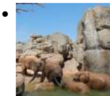
Der Bioparc Valencia, ein platz für Tiere [9]