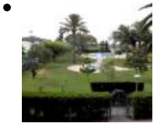
Devesa Gardens [4]