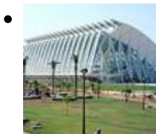
Museu de les Ciències Príncep Felipe [3]

Außen wie innen gleichermaßen spektakulär. Mit fünf Stockwerken und einer Fläche von 42 000 m 2 wurde das Museum der Wissenschaften mit Hilfe einer komplizierten