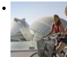
Ciutat de les Arts i les Ciències [1]