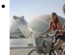
Ciutat de les Arts i les Ciències [1]

Dieser Freizeitkomplex, bei dem die Kultur im Mittelpunkt steht, richtet seine Aktivitäten auf drei große Themenbereiche: Kunst, Wissenschaft und Natur. So hat man auf...