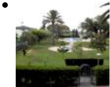
Devesa Gardens [4]