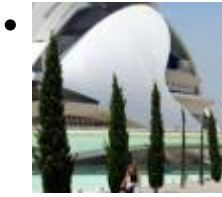
Palau de Les Arts Reina Sofía [7]

Das neueste und spektakulärste Gebäude der Stadt der Künste und der Wissenschaften wurde als globales Kulturzentrum entworfen, in dem Oper, Tanz und Open-Air-Konzerte z...