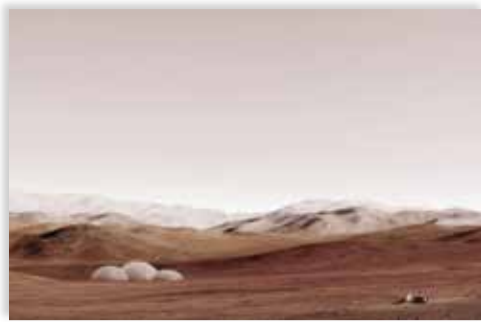
Imagen de Michael Najjar

LA FOTOGRAFÍA: RELATO PERSONAL DE UNA GENERACIÓN. Nueva Colección Pilar Citoler